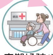
定期通院や 必要時に